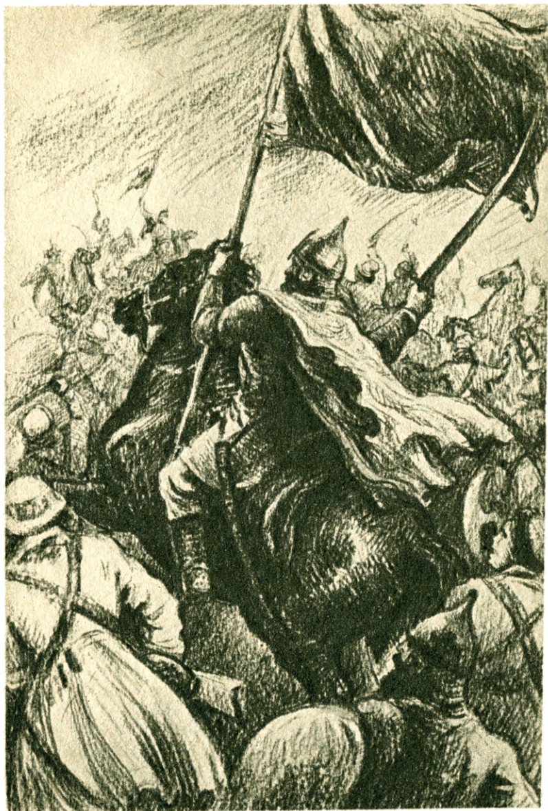
Пожарский выхватил у знаменосца свое знамя и поскакал в самую гущу боя.