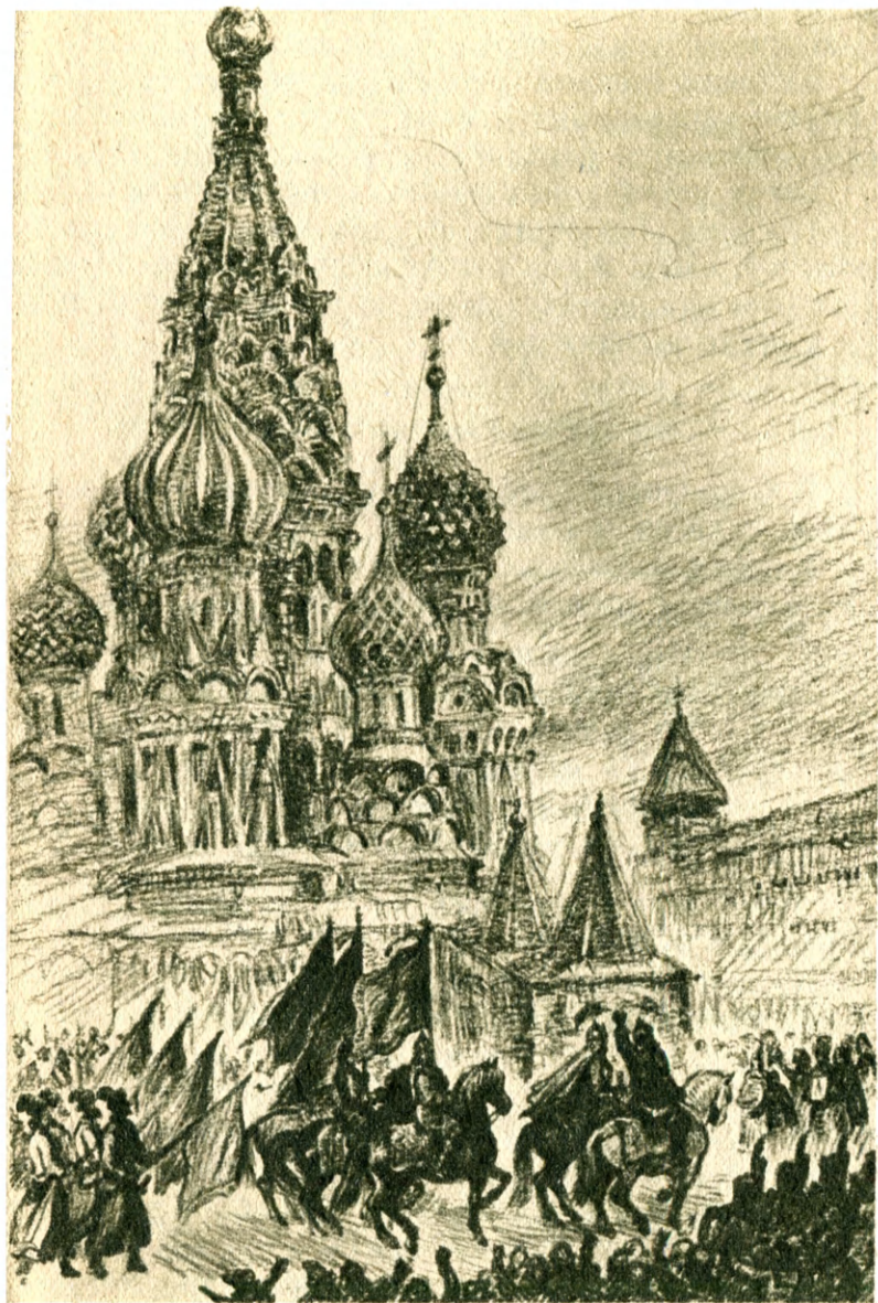
Впереди ополчения верхами ехали Пожарский и Минин.