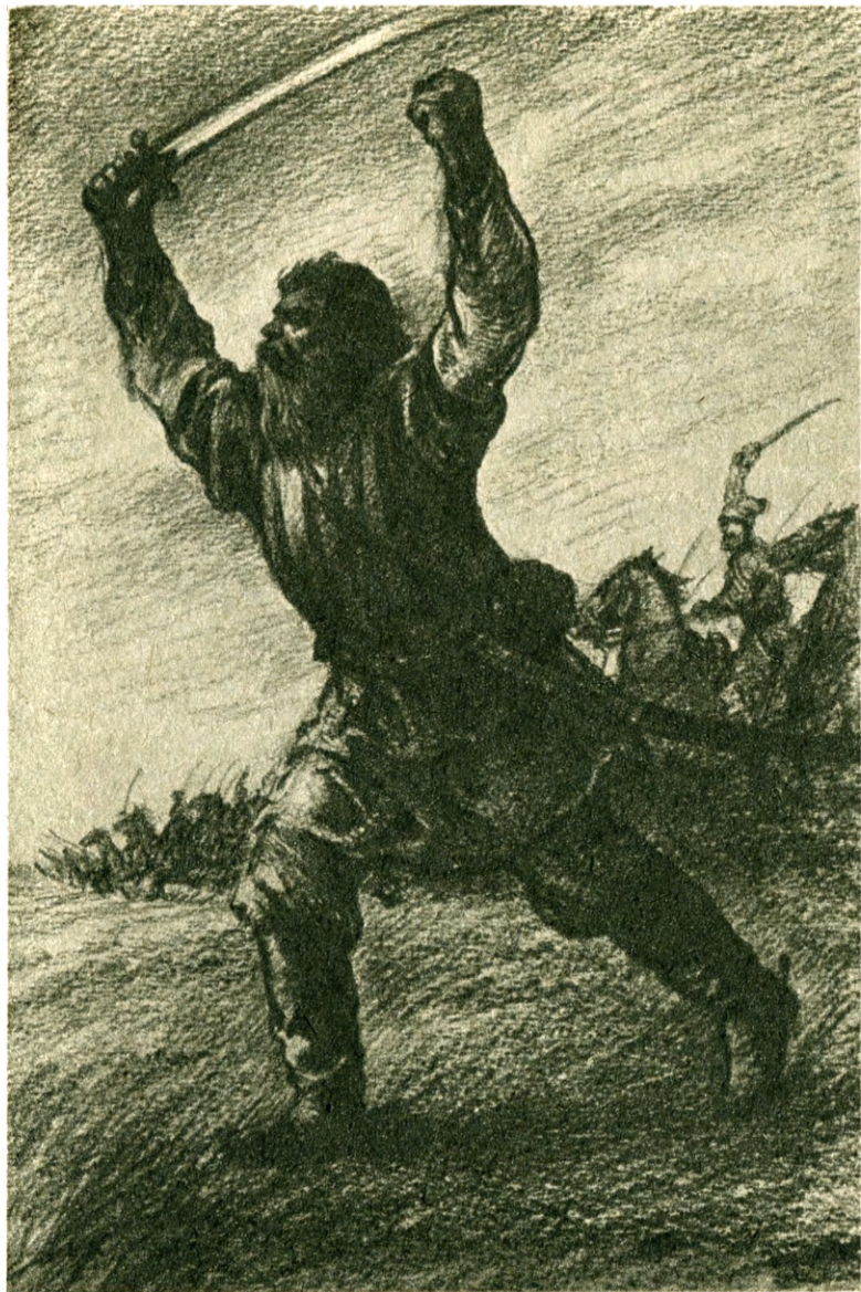
Козьма, соскочив с коня, бежал впереди своего отряда.