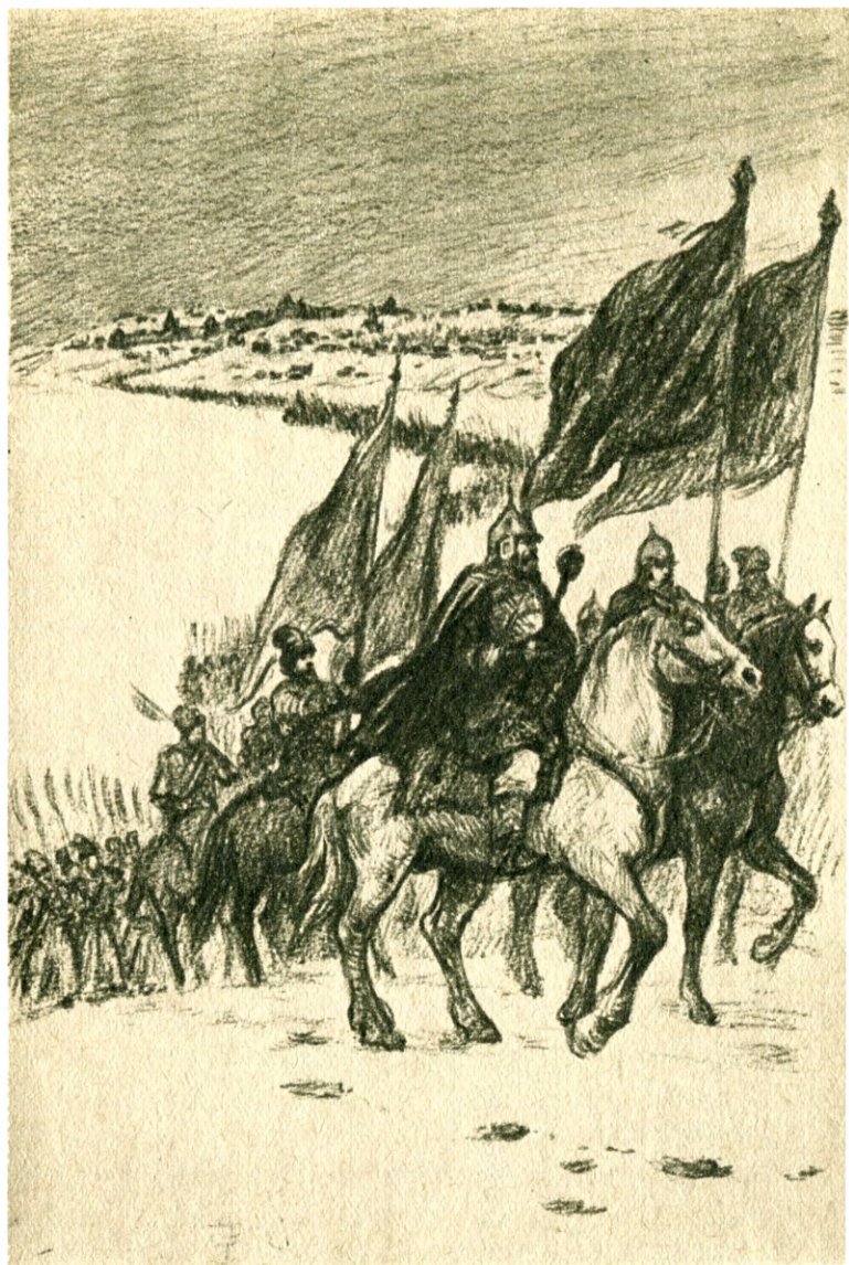
Войско шло по-новому: рядами, а не толпой.